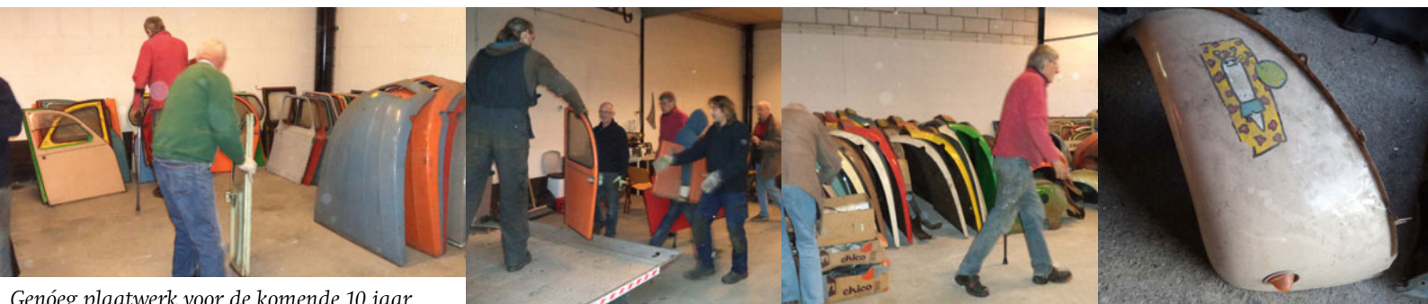
Genoég plaatwerk voor de komende 10 jaar...

VERRASSEND NIEUWS!! Ondanks de eerdere mededeling van onze 'huisbaas', de gemeente Rotterdam, dat de herstelwerkzaamheden aan onze nieuwe locatie (onder meer het wind- en waterdicht maken) pas na 1 januari 2014 plaats kunnen gaan vinden, hebben ze deze planning tóch naar voren kunnen halen en op woensdag 20 november wordt er al begonnen met het vervangen van het gehele dak van de achterste ruimte (de toekomstige stalling en onderdelenmagazijn). Dat is natuurlijk érg mooi, ware het niet dan we daar nét de héle Achthuizen voorraad hebben neergezet. Maar ook hier heeft de gemeente een creatieve oplossing voor bedacht: Ze plaatsen een lege container, waarin onze voorraad tijdens de bouwwerkzaamheden in opgeslagen wordt. In een tweede container wordt het asbesthoudend materiaal geborgen en later afgevoerd. De 'gezondheids'vragen van leden zijn hiermee dus opgelost!