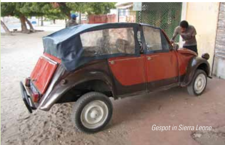
Gespot in Sierra Leone