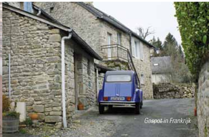
Gespot in Frankrijk